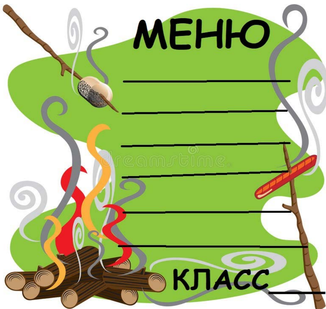
Рис. 7. Меню