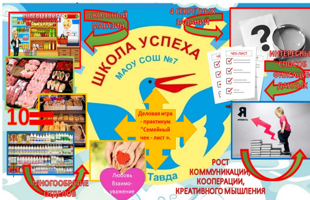
Рис. 1. Инфографика игры