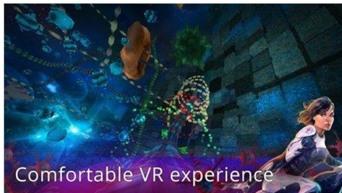
Рисунок 11. InCell VR (Cardboard)