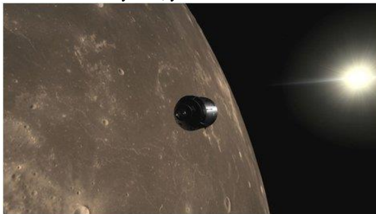
Рисунок 12. Apollo 11 VR

Titans of Space VR - обучающее приложение, которое позволит вам принять участие в экскурсии по Солнечной системе. Трёхмерные модели планет с детальной прорисовкой всех континентов и океанов, реалистичная анимация движения атмосферы Юпитера - одним словом такого вы не увидите даже в фантастических фильмах! Вдобавок к этому в течение всего полета нас будет сопровождать спокойная классическая музыка, усиливающая впечатление от увиденного.