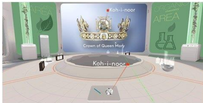
Рисунок 8. MEL Chemistry VR Уроки химии