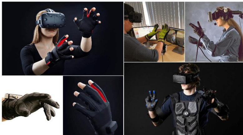
Рисунок 2. Информационные перчатки.