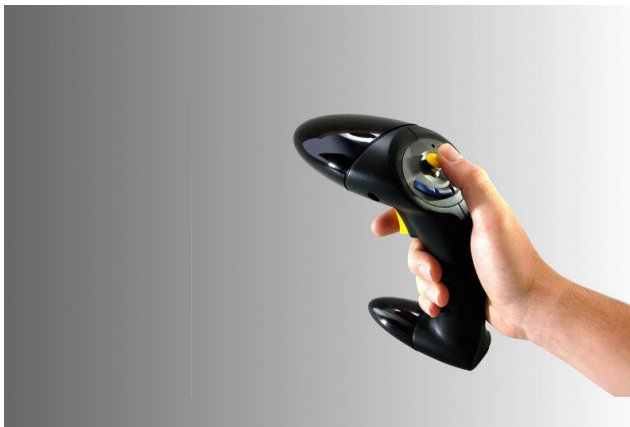
Рисунок 3. Джойстик.

Специальные устройства для взаимодействия с виртуальной средой, содержащие встроенные датчики положения и движения, а также кнопки и колеса прокрутки, как у мыши. Сейчас их все чаще делают беспроводными, чтобы избежать неудобств и нагромождений при подключении к компьютеру (рис. 3).