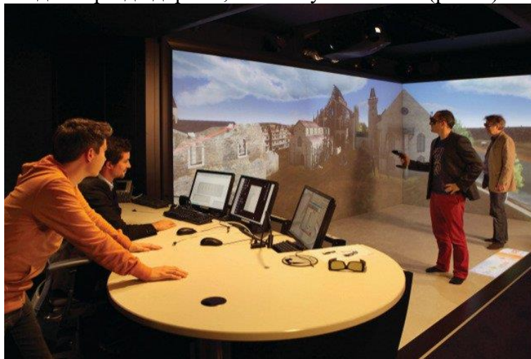
Рисунок 1. Комната VR.

Альтернатива для тех, кто не хочет испортить прическу — изображения в данном случае транслируются не в шлем, а на стены помещения, часто представляющие собой дисплеи MotionParallax3D (хотя для более полного UX в некоторых таких комнатах нужно надевать 3D-очки или даже комбинировать CAVE и HMD). Есть мнение, что VR-комнаты гораздо лучше VR-шлемов: более высокое разрешение, нет необходимости таскать на себе громоздкое устройство, в котором некоторых даже укачивает, и самоидентификация происходит проще благодаря тому, что пользователь имеет возможность постоянно себя видеть. Тем не менее, приобретение такой комнаты, понятное дело, выйдет гораздо дороже, чем покупка шлема (рис. 1).