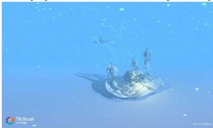
Рисунок 9. Tilt Brush

Даже если ребёнок не будет связывать свою дальнейшую жизнь с искусством, вполне вероятно, что к моменту, когда он будет получать профессиональное образование, проектирование в виртуальной реальности для многих специальностей станет обычным делом. К сожалению, VR-шлемы, необходимые для этой программы, всё ещё довольно дорогое оборудование (рис. 9).